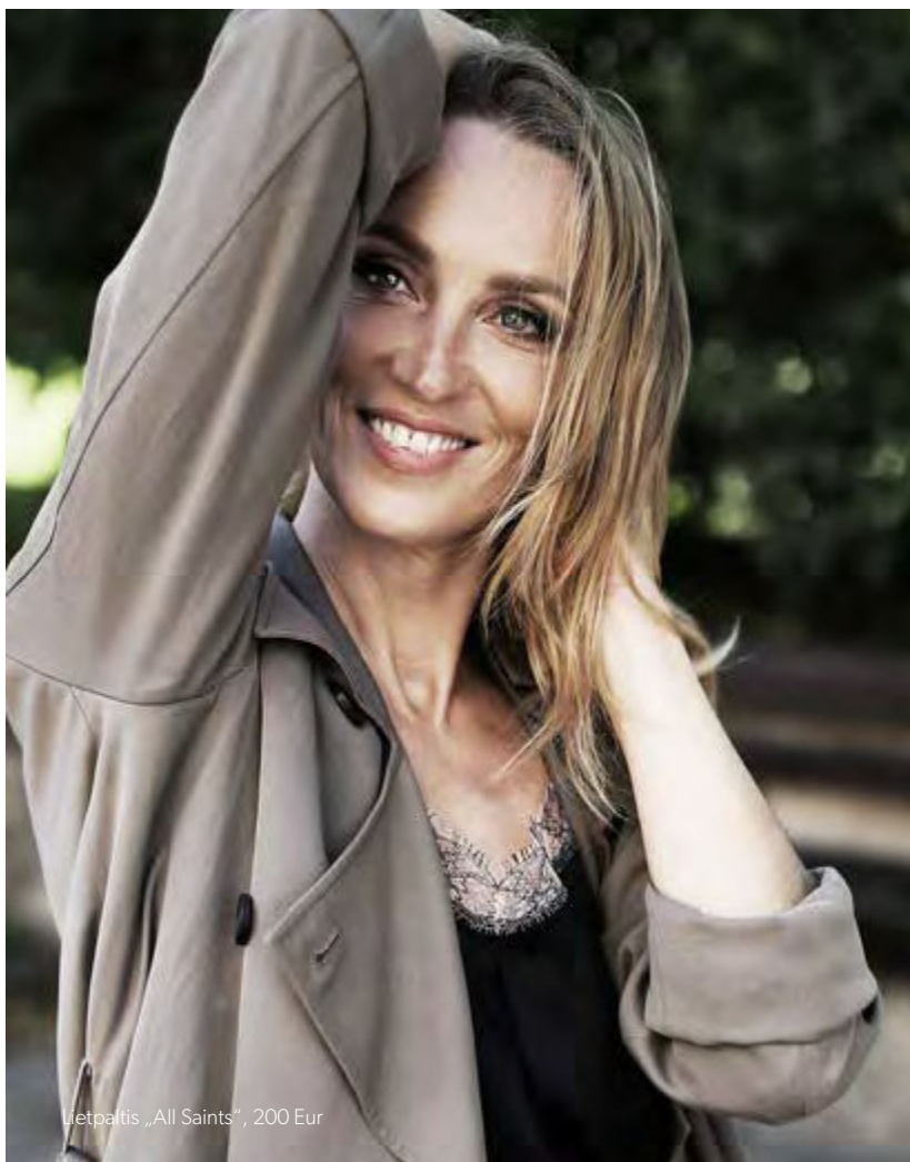
Lietpaltis „All Saints“, 200 Eur