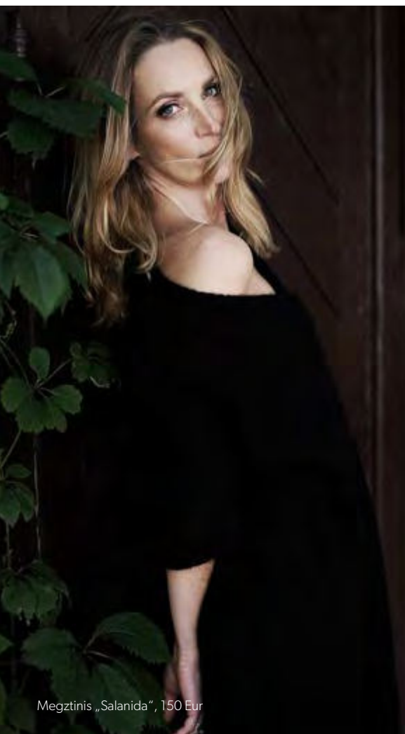
Megztinis „Salanida“, 150 Eur